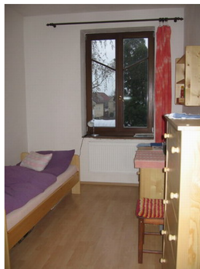
Obr4 Klientský pokoj v hlavní budově

byl v návrhu spíše oživen původní vesnický charakter zástavby celého statku s pravidelnými sedlovými střechami na domech, situovaných po obvodu dvora. Hlavní statek je využit pro bydlení rodin, pro dílny a pracovny, v zachované jídelně bude zřízen sál komunitního centra. K tomuto pozemku je ještě k dispozici další pozemek o dva statky blíže k nedaleko tekoucímu Labi, na kterém by měla stát část farmy s využitím přilehlých ploch pro zelenářskou zahradu.